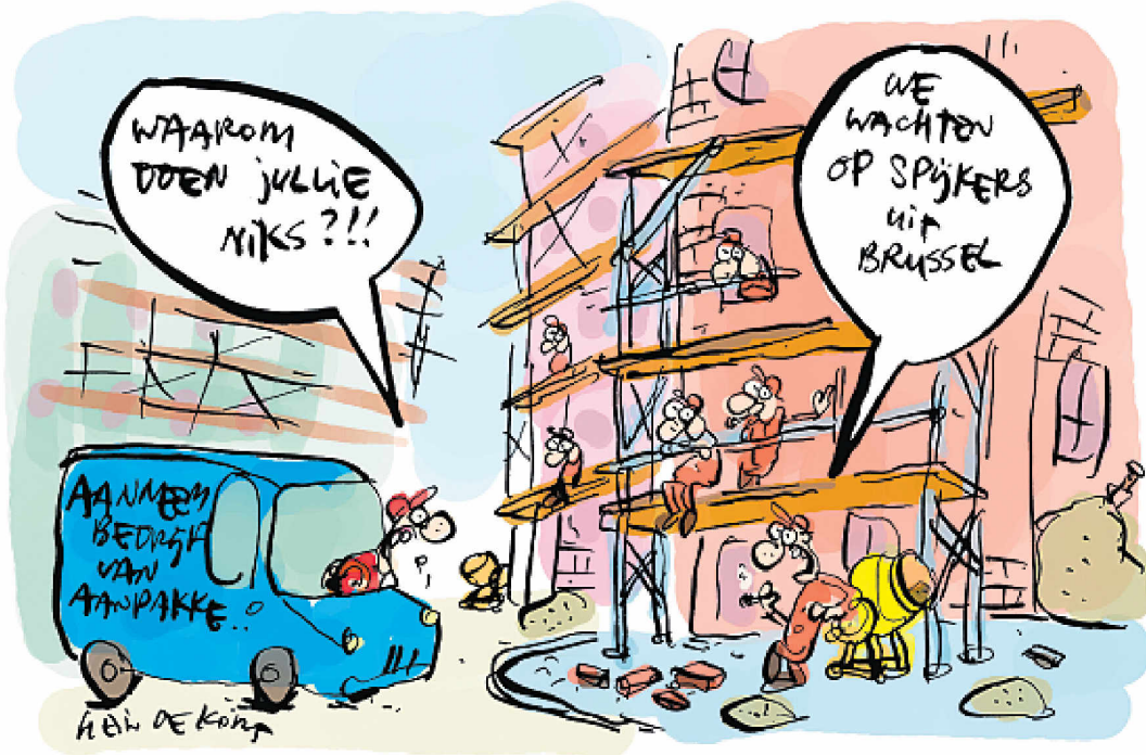
Illustratie: Hein de Kort